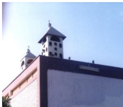
Figura 2. Palomar de la Facultad de Medicina de la Universidad Nacional San Luis Gonzaga.

La información obtenida se consolidó en una base de datos de Excel®; los datos fueron analizados con estadística descriptiva calculando las frecuencias.