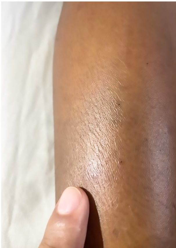
Figura 2. Equimosis en cara lateral de la pierna derecha por mordedura de Bothrops .

Luego de 7 días de tratamiento, el paciente mostró una mejora significativa, manteniéndose hemodinámicamente estable con una disminución notable del edema y del dolor. Finalmente, el (13/10/2022) fue dado de alta con indicaciones médicas para continuar el seguimiento ambulatorio.