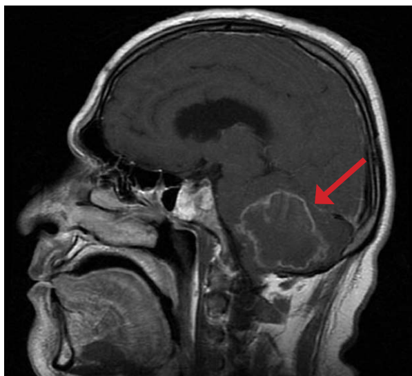
Figura 1. Resonancia magnética de vista lateral en donde se observa el cuerpo tumoral en zona cerebelar

inhalación de sus esporas en su fase micelial. En la mayoría de los casos la enfermedad aparece como una reactivación endógena que se desarrolla años después del contacto inicial con el hongo (6,7). El hongo puede ser encontrado en animales silvestres como Dasypus novemcinctus , D. septemcinctus (armadillos), Procyon cancrivorus , Cavia aperea , Sphiggurus spinosus , Gallictis vittata , Eira barbara , y también en caninos (3).