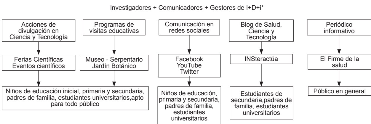
Figura 1. Estrategias de Divulgación de la Ciencia, Tecnología e Innovación en el Instituto Nacional de Salud.

La estrategia digital de redes sociales requiere mediciones y análisis de indicadores de medición periódica. Entre los indicadores destacan: el número de usuarios, número de impresiones (número de veces que un post apareció en el timeline ), número de interacciones (cantidad de «me gusta», comentarios y compartidos), y alcance (número de personas a las que se ha mostrado la publicación), reproducciones de los videos, entre otros.