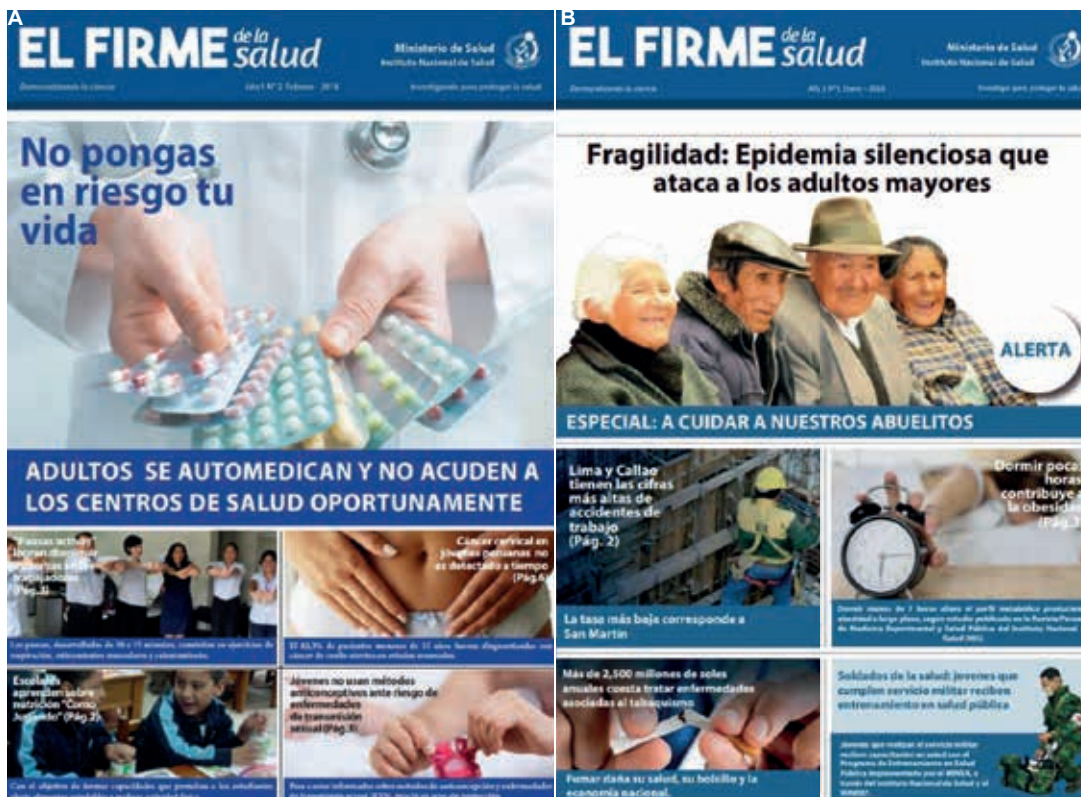
Figura 3. Portadas del periódico mensual «El Firme de la salud» A) Número 2 mes de febrero 2018, B) Número 1 mes de enero 2018.

Es una publicación mensual que tiene como lema «Democratizando la ciencia», su objetivo es presentar aquellas publicaciones científicas de la Revista Peruana de Medicina Experimental y Salud Pública (RPMESP) seleccionadas por: a) importancia en la salud pública nacional, b) posibilidad de impacto como noticia, c) actualidad de tema tratado y d) contener información de aplicación en la población peruana. También incluye publicaciones científicas seleccionadas de revistas científicas internacionales que cumplan con los criterios anteriores. El periódico es distribuido en formato impreso, y en formato digital a través del portal web del INS. (Figura 3).