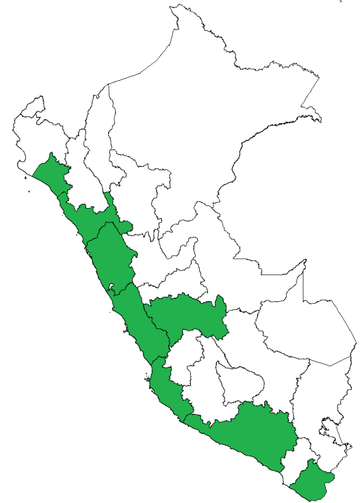
Formación mayor a 100 por año)