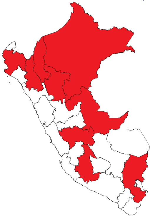
Déficit de médicos ( < 7 por 1000 hab.)