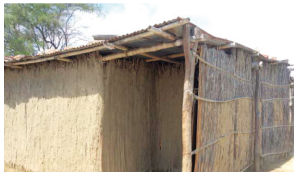
Figura 6. Viviendas características del Bajo Piura con techo bajo y poco ventiladas que durante las altas temperaturas ambientales inducen a la hipertermia y golpe de calor.