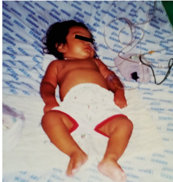
Figura 2. Niño de 2 años tres meses de edad que desarrolló golpe de calor y falleció, durante el fenómeno de El Niño en el año 1998.