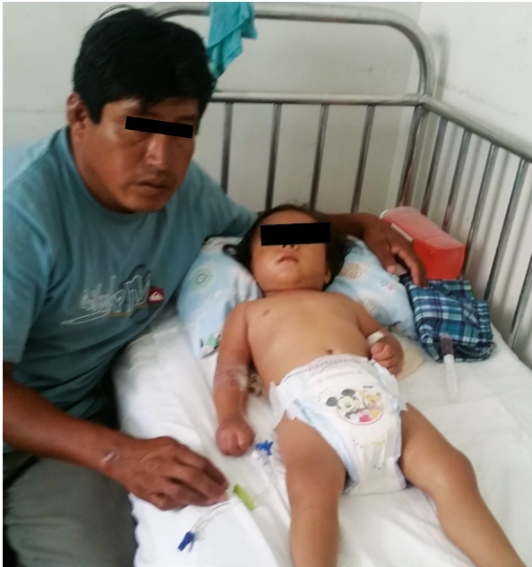
Figura 1. Niño de 1 año 4 meses de edad procedente del Bajo Piura que ingresó al hospital Cayetano Heredia de Piura, con hipertermia y desarrolló golpe de calor durante el fenómeno de El niño el año 2016.